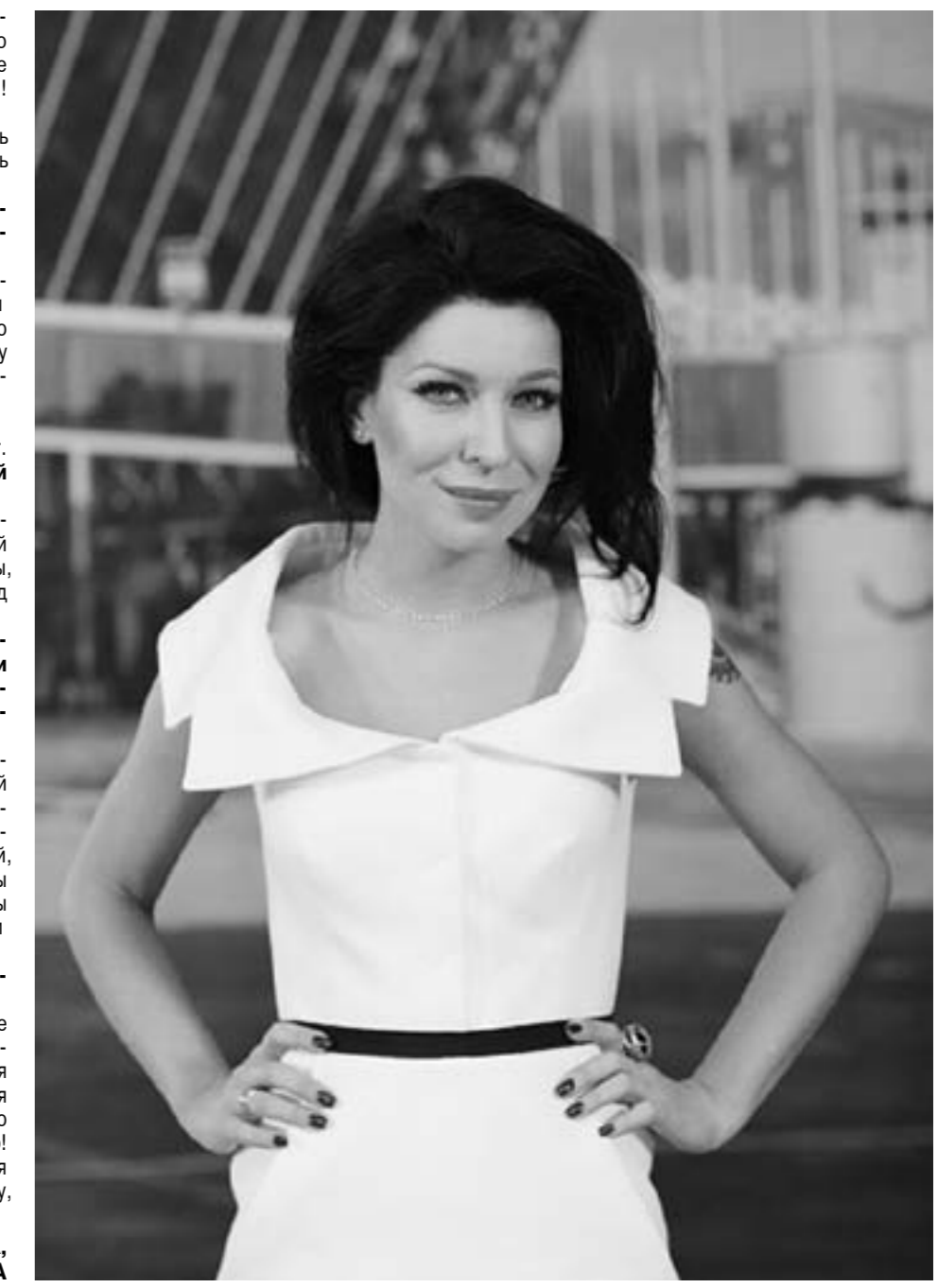
Фото с обложки

что футбол - это мое. И вот уже два года я большая поклонница этой игры. Таков вот «не женское» хобби. Ты теперь не просто болельщица, а первая в нашей стране Мисс «РФПЛ». Расскажи о своем участии в конкурсе. В прошлом году я стала Мисс ФК «Кубань», а в этом году мне позвонили из клуба и предложили принять участие во всероссийском конкурсе. Я с удовольствием согласилась. Конечно, не думала, что стану победительницей. Если честно, считала, что уже давно решено, кто какое место займет. И тут победа! Слов нет, чтобы описать охватившую меня тогда радость.